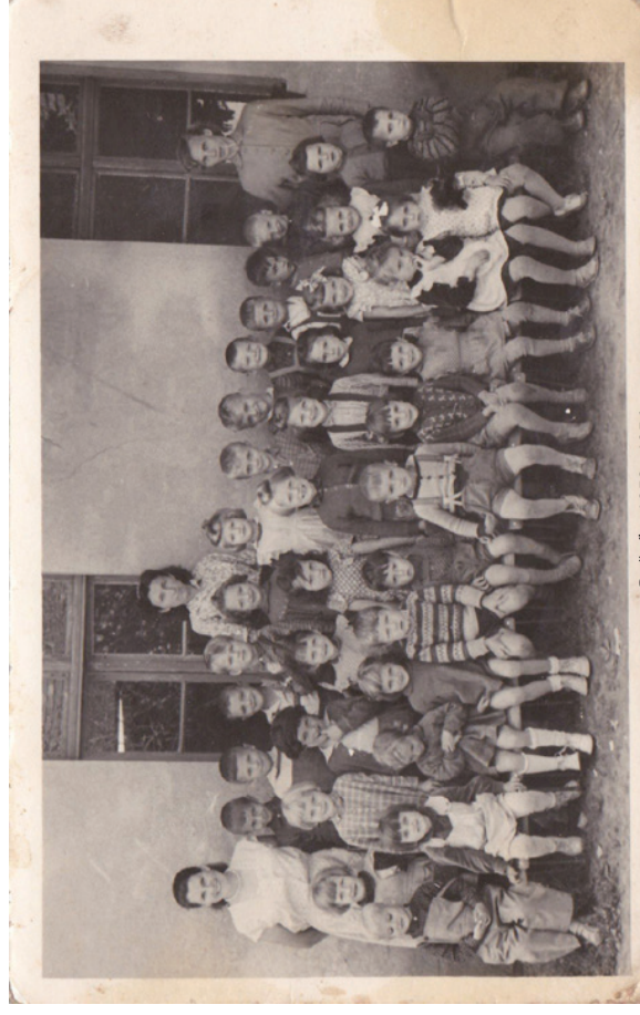
Ročníky 1952 - 1956