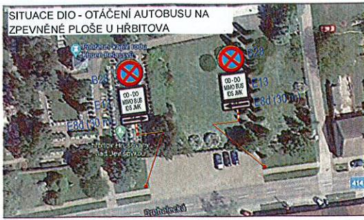
SITUACE DIO - OTÁČENÍ AUTOBUSU NA ZPEVNĚNÉ PLOŠE U HRBITOVA